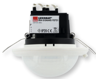
Deckeneinbau - DE