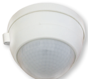
Aufputz - AP